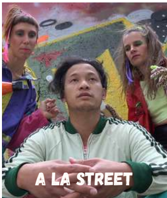
A LA STREET