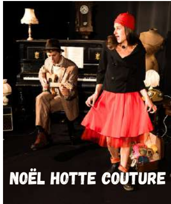
NOËL HOTTE COUTURE