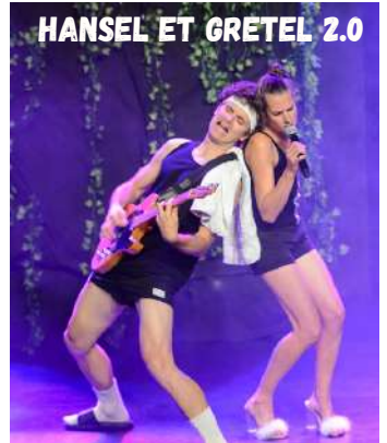
HANSEL ET GRETEL 2.0