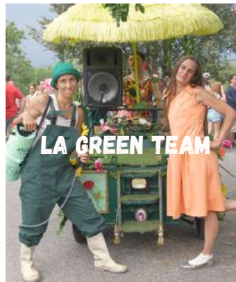
LA GREEN TEAM