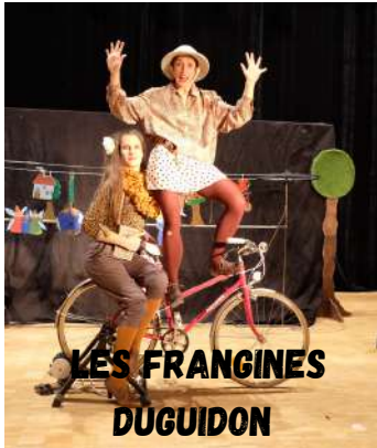
YES FRANGINES DUGUIDON